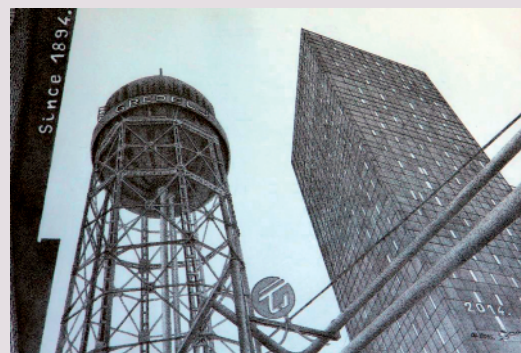
Špiro Dmitrović PROŠLOST SUSREĆE BUDUĆNOST / tuš