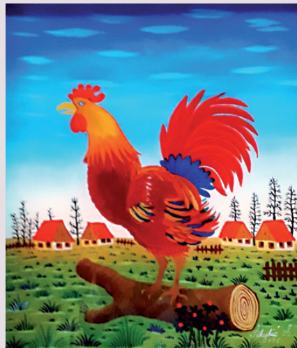
Stjepan Sekulić / PUJETAO / olje na platnu