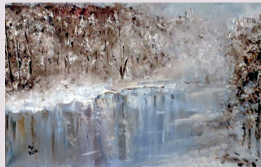
Ljubica Vučinić / ZALEĐENO JEZERO / olje na platnu