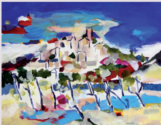
Antonija Celin / ROČ / akril