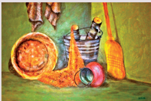
Josip Mušanović / KONOBA / akril