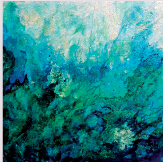
Dubravka Mijatović / POD MOREM / mix media