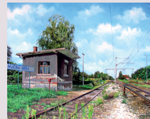
Marija Grabar / VAHTARNA MUČNA REKA / olje na platnu