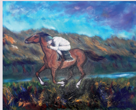
Kruno Klemar / ĐOKEJ / olje na platnu