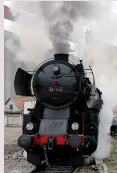
Sragutin Staničić PARNA LOKOMOTIVA SERIJE 33-037 foto

Razstava likovnih ustvarjalcev Udruge željezničara slikara Plavo svetlo (Društva železničarjev slikarjev Modra luč) iz Zagreba je odprta