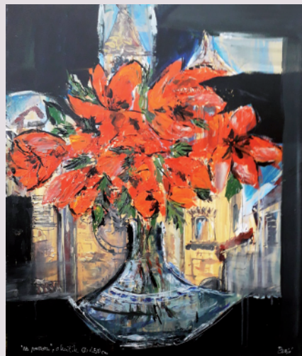
Davorka Borić VAZA NA PROZORU / akril na platnu