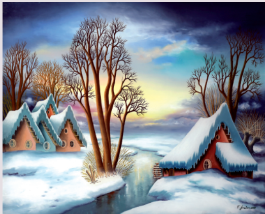
Tomislav Grabar / ZIMA / olje na steklu