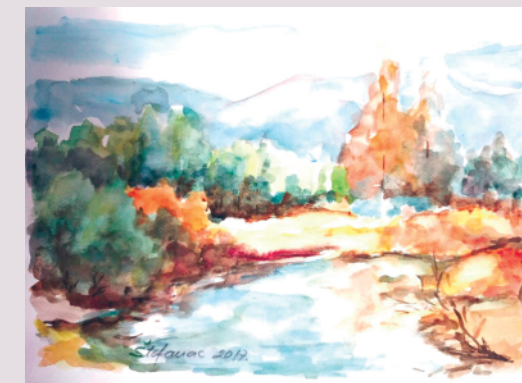
Marija Bertić Štefanac / PEJZAŽ / akvarel