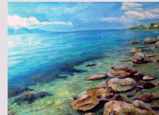
Antun Stipetić / MORSKA OBALA / olje na platnu