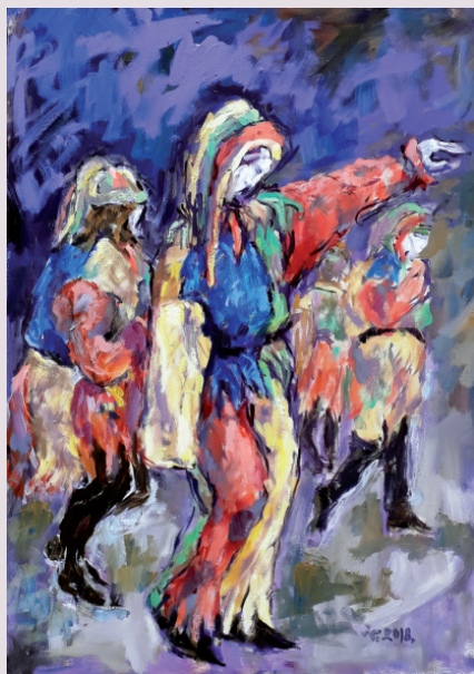
Ivanka Švabek / KARNEVAL I / olje na platnu