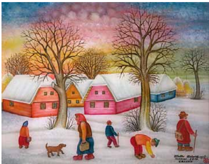
Zimske aktivnosti, olje na steklo, 40 x 50, 2011