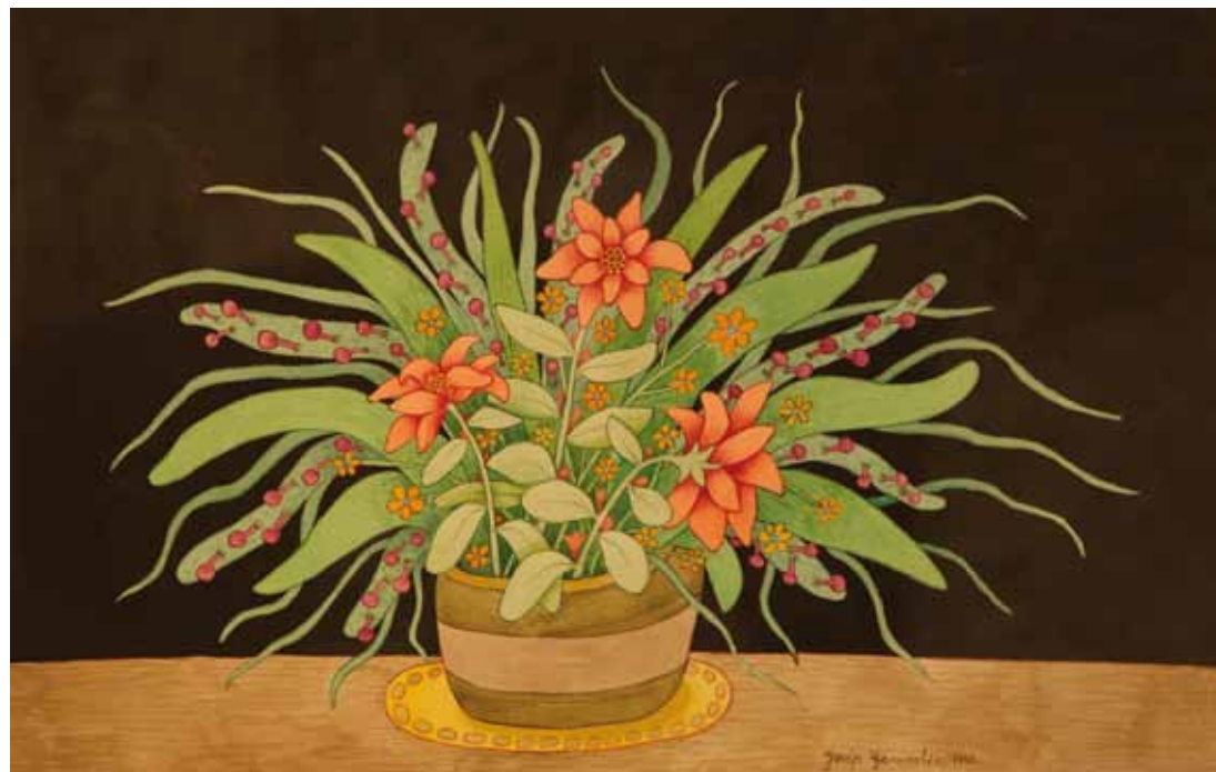
Trije rdeči cvetovi, akvarel, 50 x 80, 1998