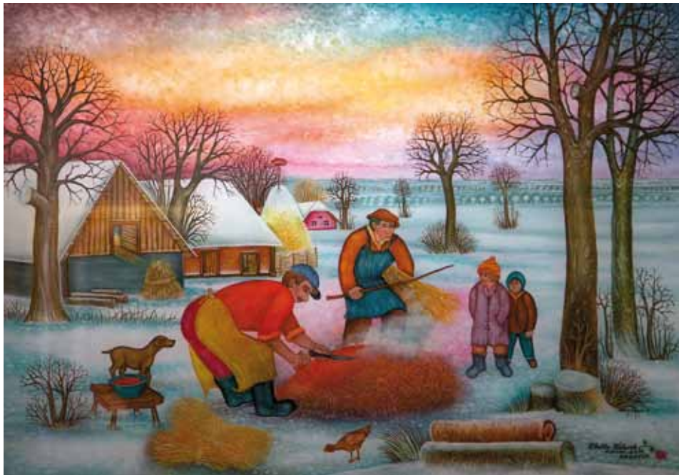
Koline na starinski način, olje na steklo, 50 x 70