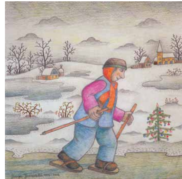
Drsalec, akvarel, 50 x 50, 2004