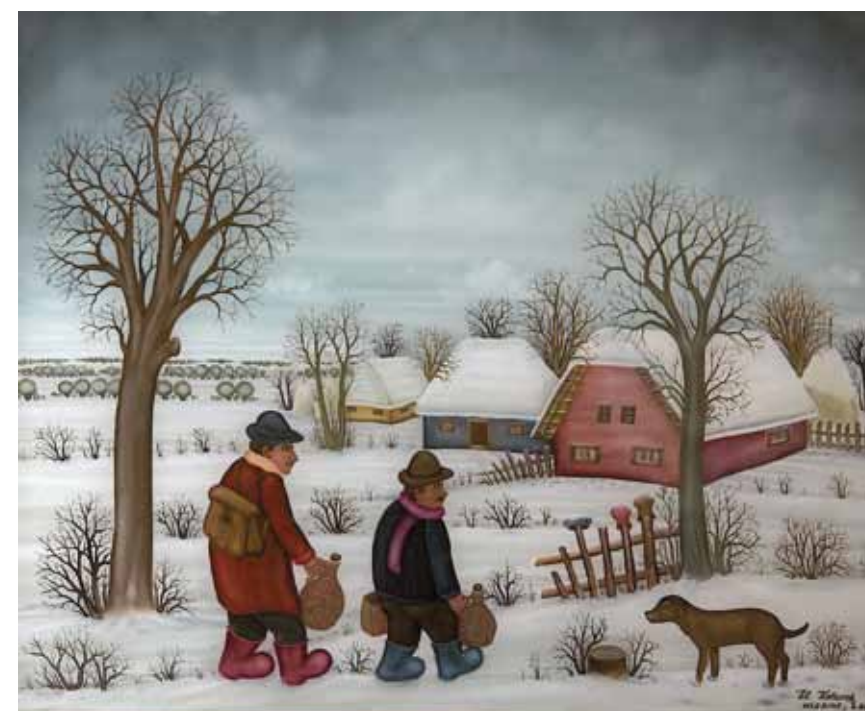
Vračanje iz goric, olje na steklo, 50 x 60, 2001