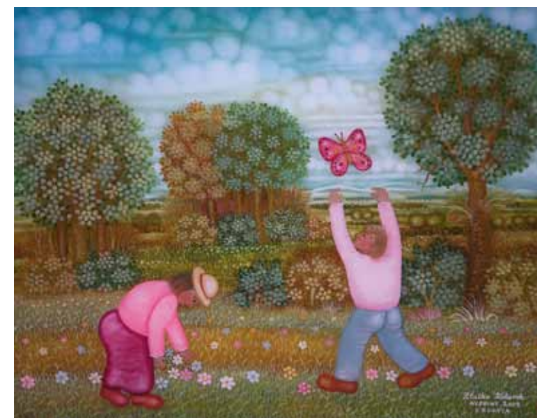
Lovim metulja, olje na steklo, 40 x 50, 2009