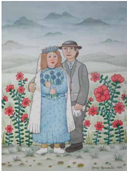
Mladoporočnica, akvarel, 50 x 42, 1994