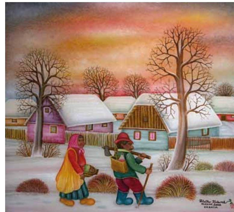
Cigani, olje na steklu, 55 x 50, 2008