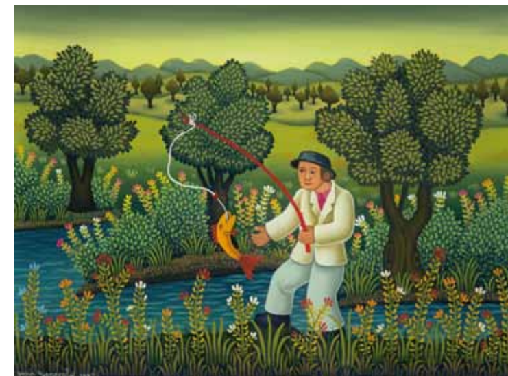
Ribič, olje na steklo, 40 x 50, 1992