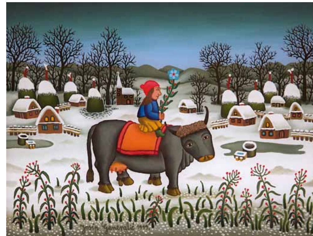
Deklica na kravi, olje na steklo, 27 x 35, 1994