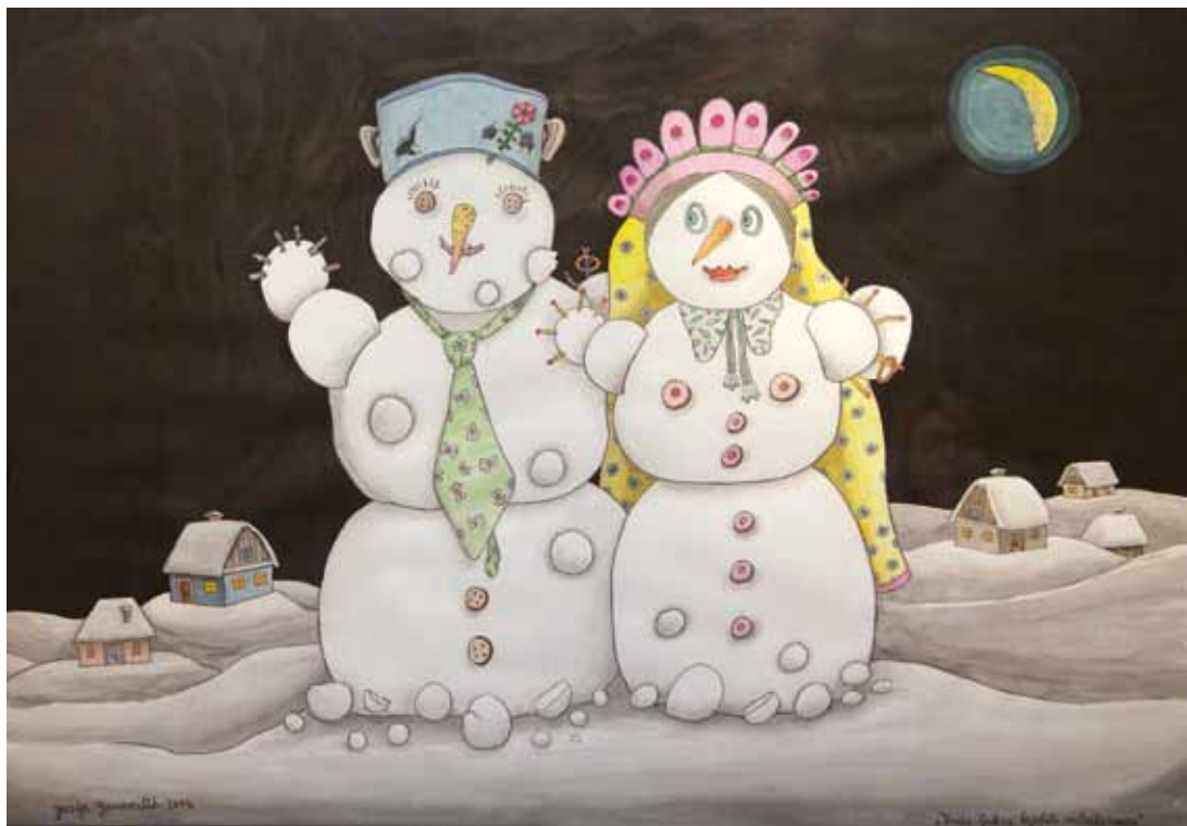
Dva snežaka, akvarel, 70 x 100, 2004