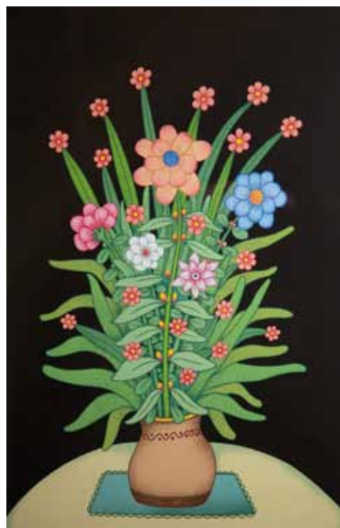
Cvetje, grafika svilotisk, 60 x 40, 1999