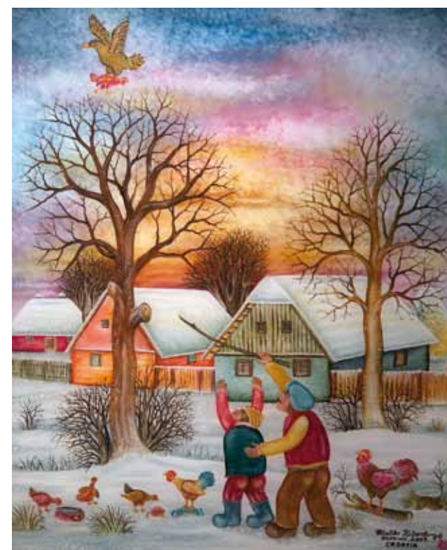
Jastreb nosi kokoš, 55 x 45, 2009