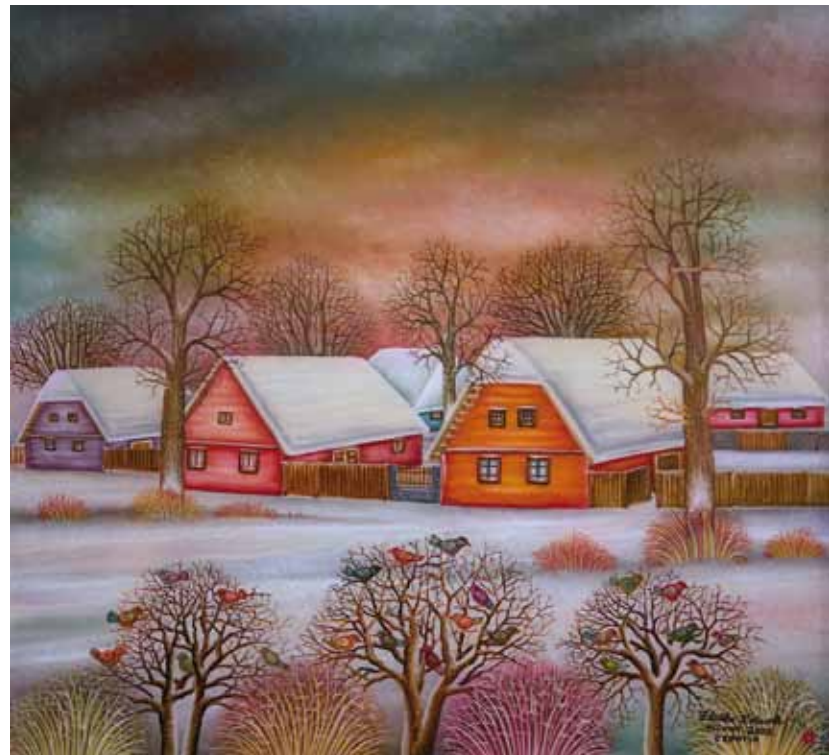
Ptice pozimi, olje na steklo, 55 x 50, 2008