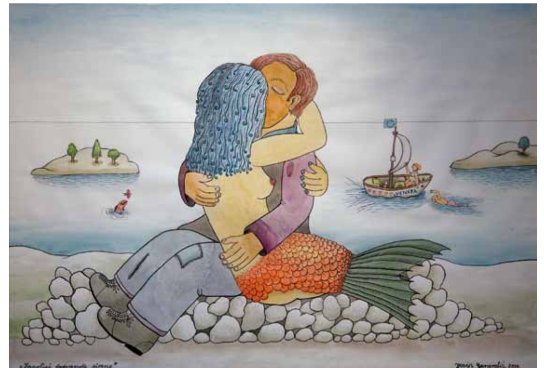
Objem sirene, akvarel, 70 x 100, 2004