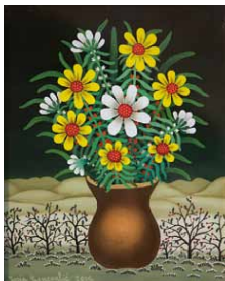
Rumeno cvetje, olje na steklo, 30 x 25, 2000