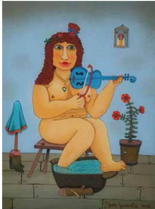
Žena z violino, olje na steklo 60 x 45, 1998