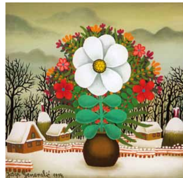
Cvetje v vrču, olje na steklu, 20 x 20, 1994