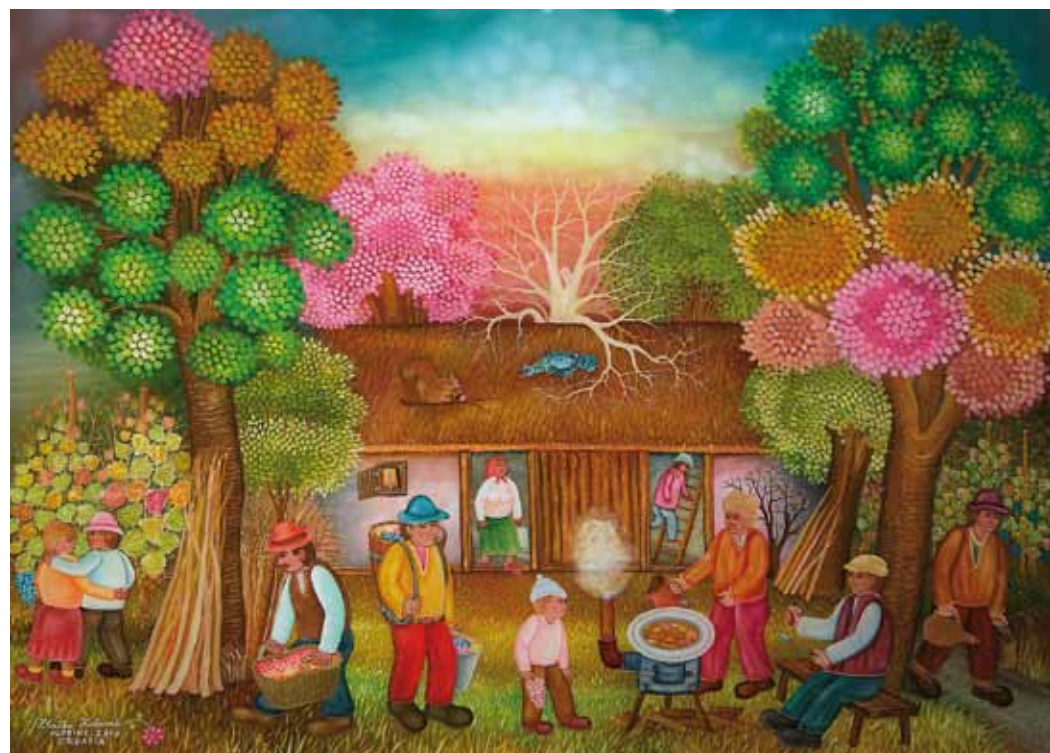
Pred kletjo v gorah, olje na steklu, 60 x 80, 2010