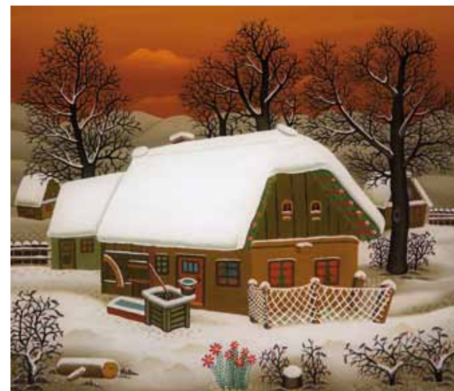
Zima z rjavo hišo, 35 x 40, 1997