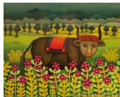
Bik, olje na steklo, 25 x 30, 2003