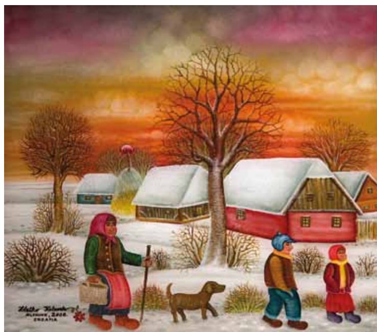
Babica in vnuki, olje na steklo, 40 x 45, 2008