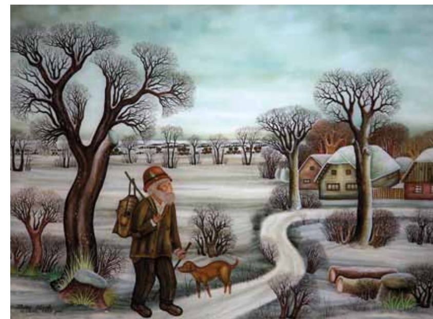
Berač, olje na steklu, 60 x 80, 1989

Slikarski navdih v napetosti življenjske in ustvarjalne moči Zlatka Kolarka ne motivira zgolj pri ustvarjanju prepoznavnih del lastnega izraza, temveč tudi v oblikovanju zbirke slikarskih in kiparskih del znanih umetnikov, ki bodo nekoč našla svoje mesto tudi v zasebni galeriji. Na ta način lahko v luči vestnega ustvarjalca, uglednega gostitelja in starša, slikarja in kulturnega delavca zaokrožimo vlogo tega umetnika iz legendarnih Hlebin.