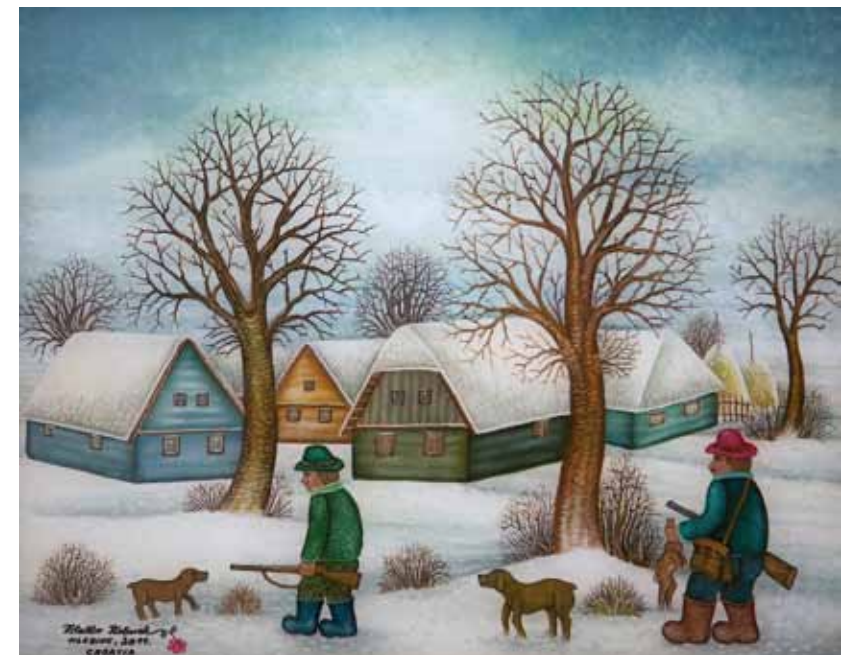
Lovci, olje na steklo, 40 x 50, 2001