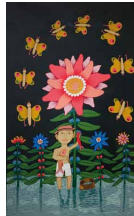
Ribič lovi metulje, grafika svilotisk, 60 x 40, 1999