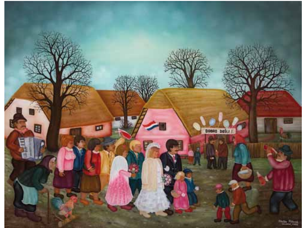
Svati, olje na steklu, 50 x 70, 2000