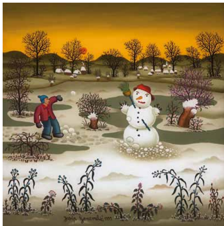
Zima s snežakom, olje na steklo, 50 x 50, 1999