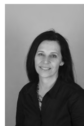
Katarina Salamon MESTO SE BUDI akril, 50x60