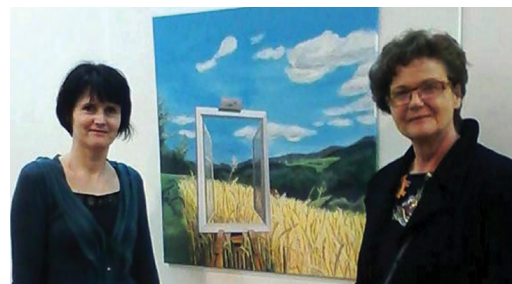
Naša Polonca na državni razstavi s svetovalko za likovno dejavnost na JSKD (2014)