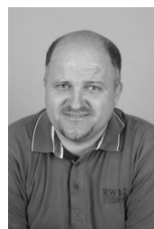
Martin Čater RAZVAJANJE akril, 70x50