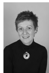
Vanja Glavač ZIMSKA NOSTALGIJA akril, 60x50