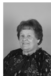
Nežika Tatarevič JUTRO V PLANINAH akril, 50x60