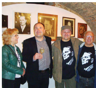
Tito na podobah spominov (2013)