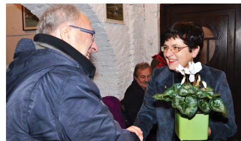
Za udarniško delo smo dobili priznanje ZKD Šentjur