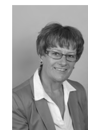
Stanka Kodrnja ORAČ akril, 70x50