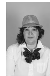
Ela Kavka AKT akril, 50x70