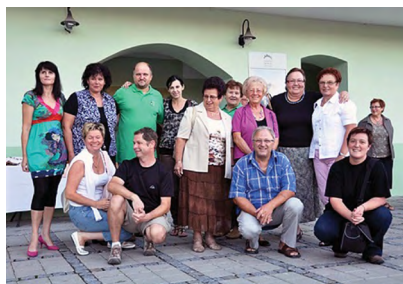
Pred Galerijo Zgornji trg ob skupniski razstavi (2011)