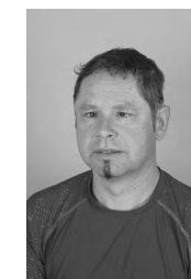
Bojan Cmok TIHOŽITJE akril, 70x50