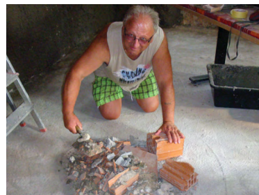
Treba je bilo tudi na kolena