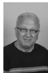
Dragan Podovac TIHOŽITJE olje, 60x50