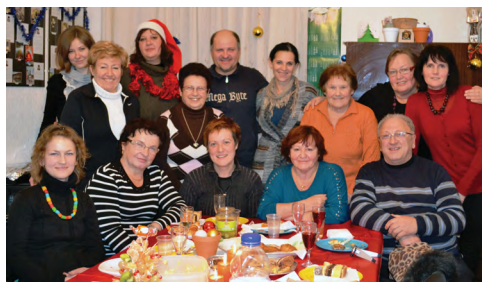
Zadnje novo leto v starih prostorih