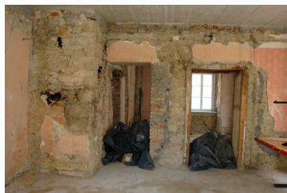
Takole je bilo na začetku... (junij 2013)