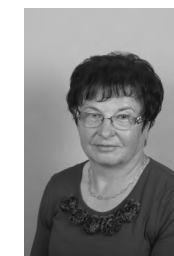
Fanika Pevec DOMAČIJA akril, 70x50