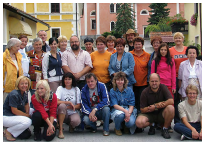
Poletni ex tempore Dobje (2008)