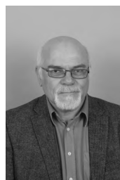
Ivo Brodej ZAČETEK POTI akril, 60x50