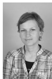
Marjana Majcen ČLOVEK POTREBUJE BARVO akril, 60x50