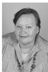
Teja Hrovatič SOLINE akril, 50x70