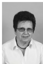
Nežika Hrovat POMLAD olje, 60x50