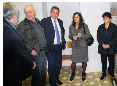
Na otvoritvi so nas obiskali visoki gostje (12.11.2013)