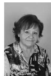
Božena Prodnik KONJ V NARAVI akril, 50x60