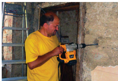
Predsednik v akciji