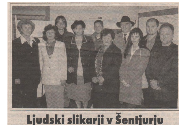
Članek v Novem tedniku ob prvi razstavi društva 23.4.1999.

Ob koncu naj zapišem še svoje želje za prihodnost: želim si, da bi nas družili ustvarjalnost, prijateljstvo in veselje. Na svidenje ob 20 letnici šentjurskih likovnikov.