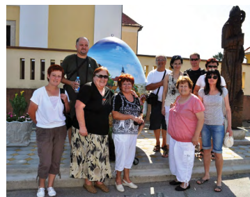
Pred znamenitim poslikanim jajcem v Hlebinah (2011)