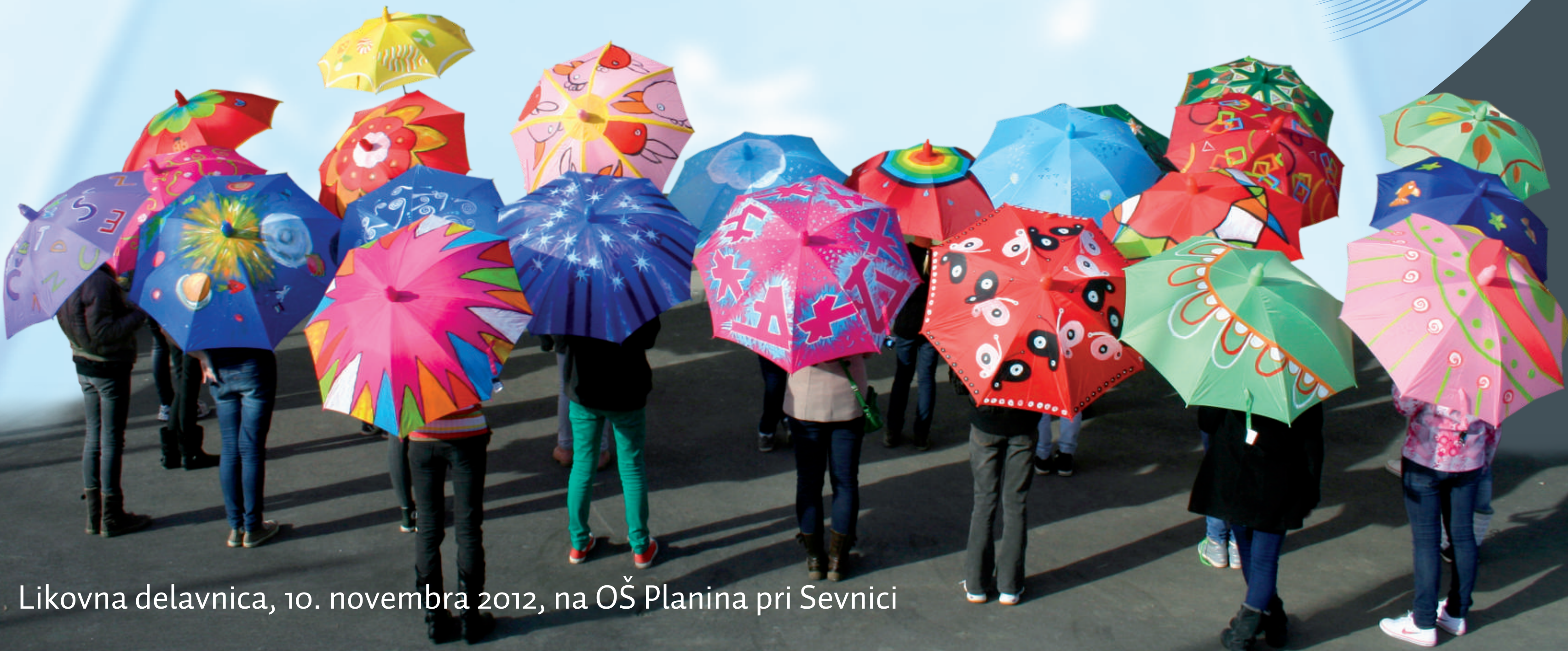
Likovna delavnica, 10. novembra 2012, na OŠ Planina pri Sevnici