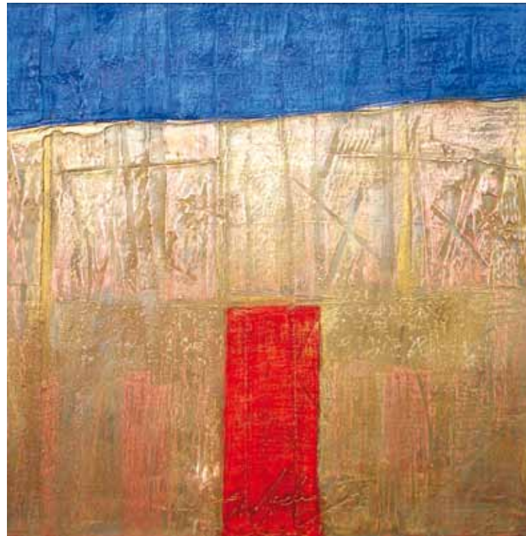
Archeo polje I, mešana tehnika, 50 x 50 cm, 2012.

Misli pesnika so tihe ptice; prihajajo na nebo, ko v prsih tišči. Tudi zaradi ljubezni, hrepenenja, ali pa svete jeze nad krivico, katerokoli.