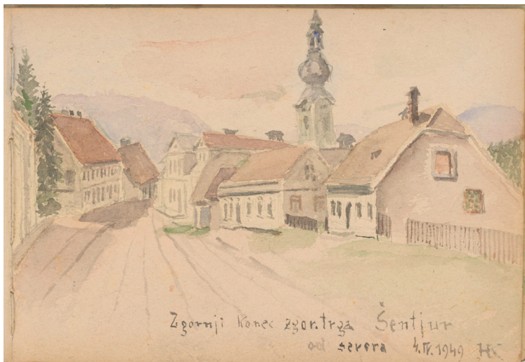
Šentjur, Zgornji trg: pogled s severa, 1949, akvarel, 15 x 22 cm