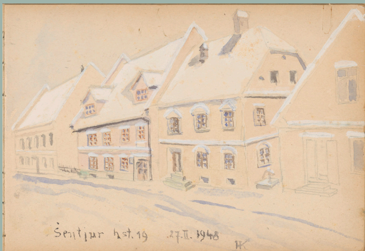
Šentjur, Zgornji trg: pogled na hišo Ulica skladateljev Ipavcev 19, 1948, akvarel (tempera), 15 x 22 cm