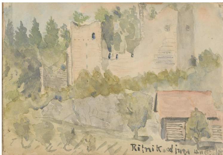
Rifnik, razvaline gradu Rifnik (Reicheneck) iz 13. stol.: pogled z juga, 1950, akvarel, 15 x 22 cm