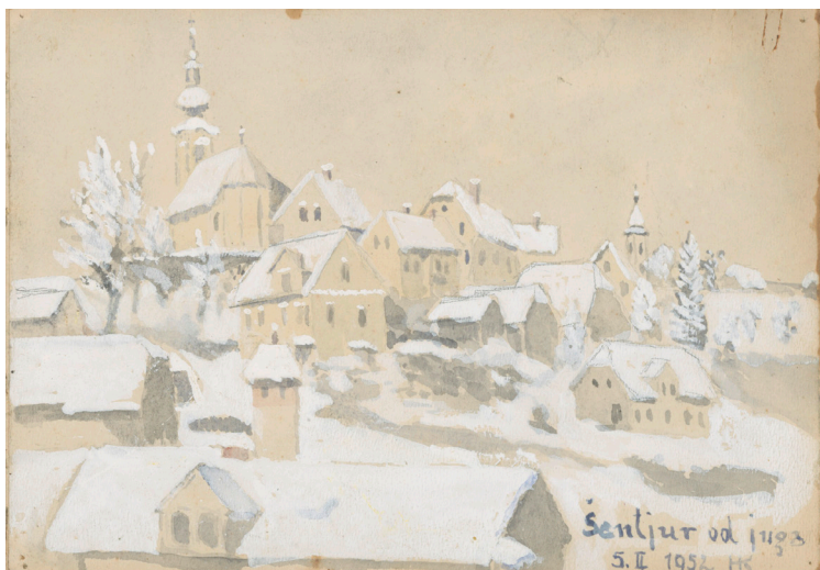
Šentjur, Zgornji trg: pogled z juga, 1952, akvarel (tempera), 15 x 22 cm (nalepljeno v akvarelni blok)