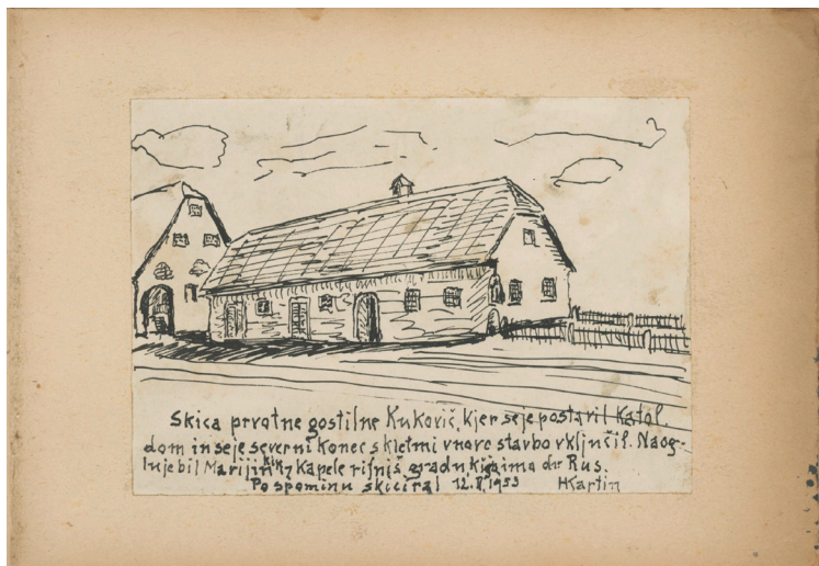
Šentjur, gostilna Kukovič: skica prvotne gostilne Kukovič, 1953, skica, 15 x 22 cm (nalepljeno v akvarelni blok)