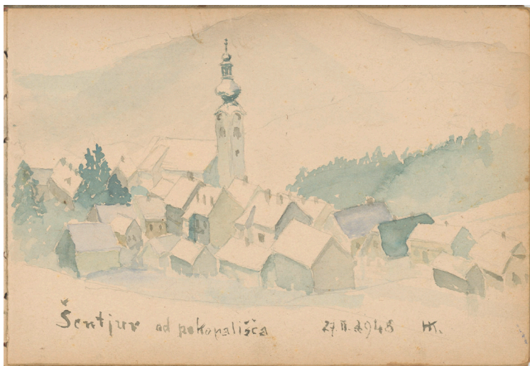
Šentjur, Zgornji trg: pogled s pokopališča, 1948, akvarel, 15 x 22 cm