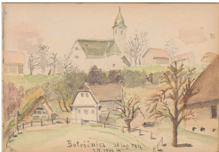
Botričnica, vas s cerkvijo Marije sedem žalosti: pogled z jugozahoda, 1949, akvarel, 15 x 22 cm