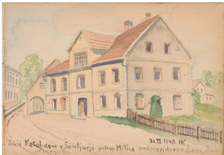
Šentjur, Kulturni dom Šentjur (bivši Katoliški dom pred prezidavo): pogled z jugozahoda, 1948, akvarel, 15 x 22 cm