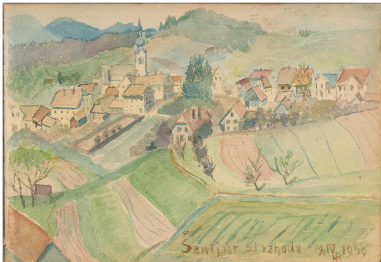
Šentjur, Zgornji trg: pogled z vzhoda, 1949, akvarel, 15 x 22 cm