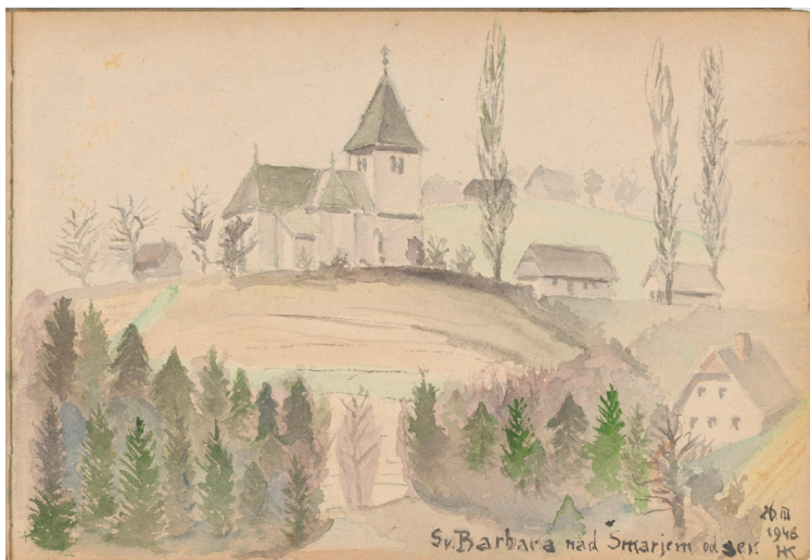
Vinski Vrh pri Šmarju, cerkev sv. Barbare: pogled s severa, 1948, akvarel, 15 x 22 cm