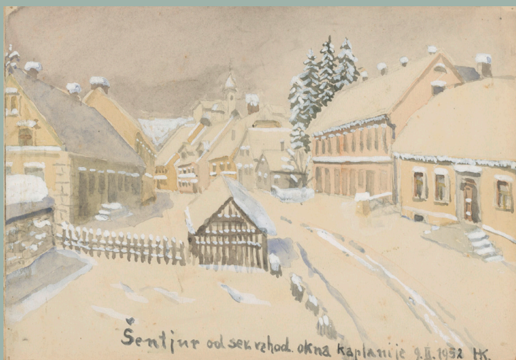
Šentjur, Zgornji trg: pogled s severovzhodnega okna kaplanije, 1952, akvarel (tempera), 15 x 22 cm