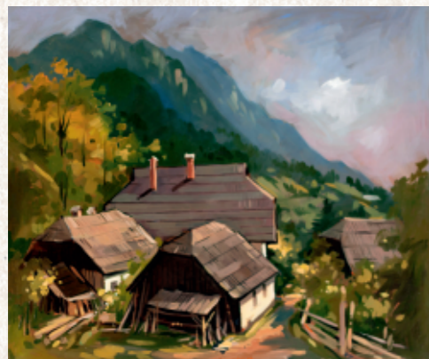
Hlebarjeva domačija na Rednjem vrhu