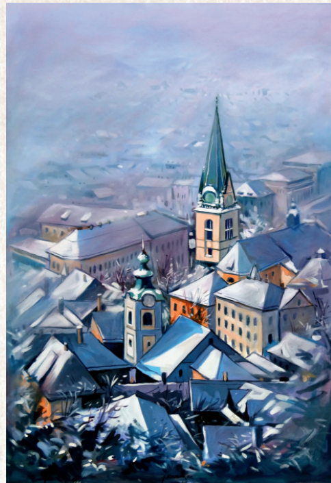
Ljubljana v snegu