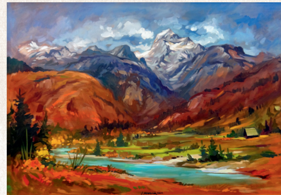
Pogled na Triglav