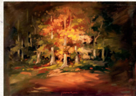
Jasa v gozdu