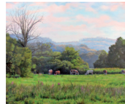
MOJA BILOGORA 50 x 60, olje na platnu