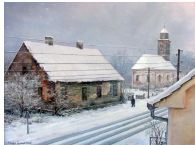
POGLED Z MOJEGA OKNA