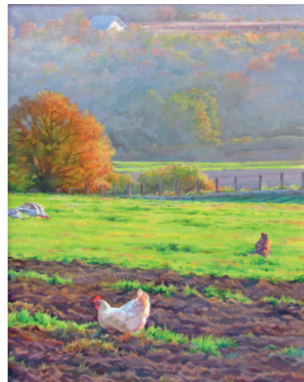
JUTRO V MOJEM KRAJU 24 x 30, olje na platnu