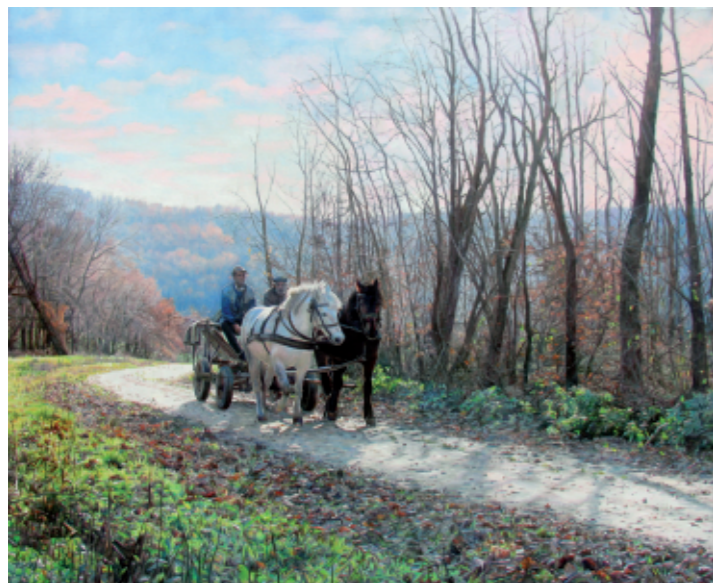
POPOVIČI GREDO PO DRVA