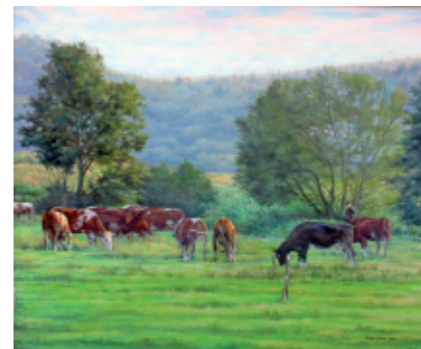
KRAVE NA PAŠI 60 x 70, olje na platnu