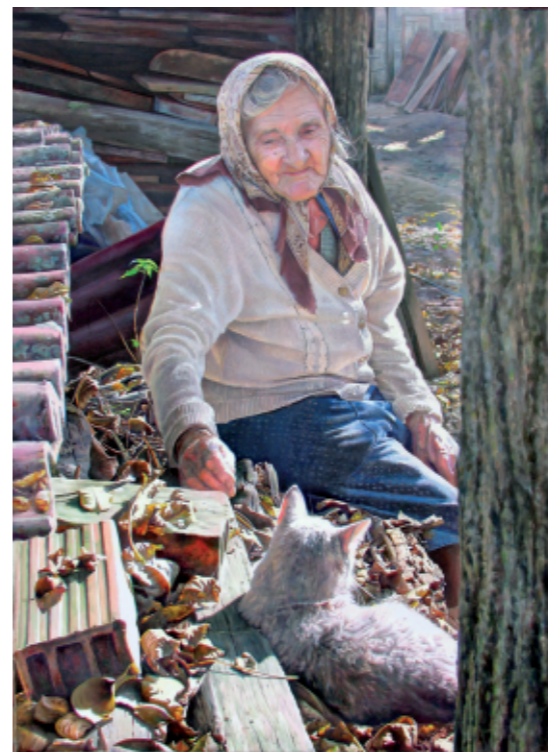
MOJA BABICA 80 x 60, olje na platnu