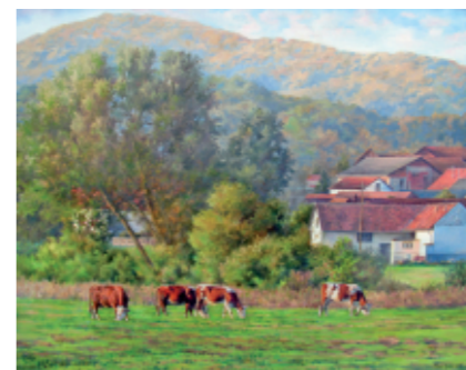
KALNIČKI KRAJ 70 x 55, olje na platnu