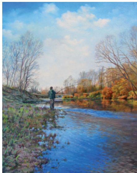
RIBIČ 40 x 50, olje na platnu