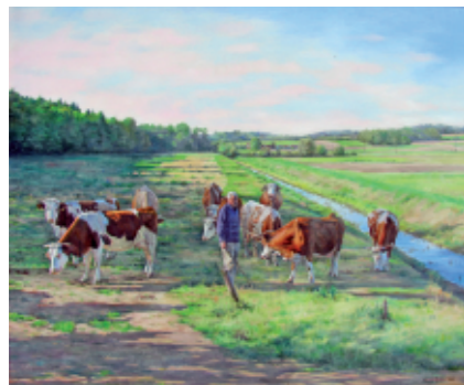
VEČERNI SPOKOJ 50 x 60, olje na platnu