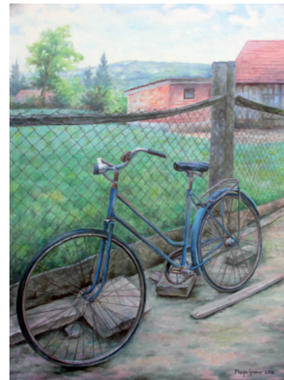
DEDOVO KOLO 40 x 30, olje na platnu