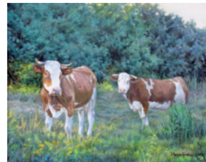
DVE KRAVI 20 x 25, olje na platnu