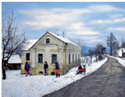
ZIMSKE RADOSTI 60 x 80, olje na platnu