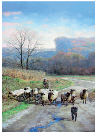
RAJNOVA ČREDA 80 x 60, olje na platnu