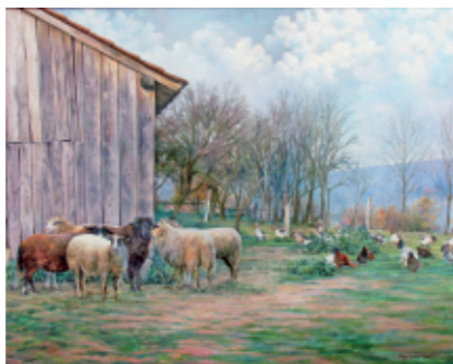
VAŠKO DVORIŠČE 70 x 55, olje na platnu